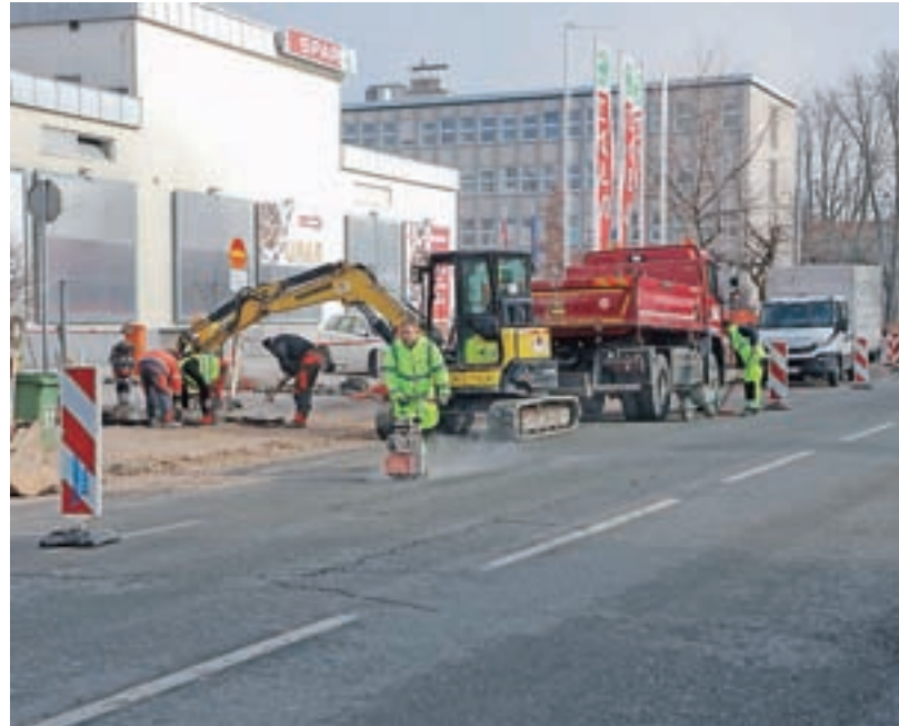
Na Cesti Staneta Žagarja od začetka februarja gradijo novo kolesarsko povezavo.

Investicijo, vredno približno 437 tisoč evrov, sofinancirata Republika Slovenija in Evropska unija iz Evropskega kohezijskega sklada v višini dobrih 242 tisoč evrov, občina pa bo prispevala preostalih 194 tisoč evrov.